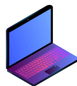
Облікова система виробника